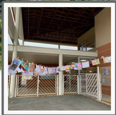
TRAVAUX DES ÉCOLES

Trois ans au service des Caveiracoises et des Caveiracois