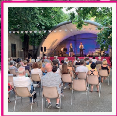
CONCERTS À CAVEIRAC