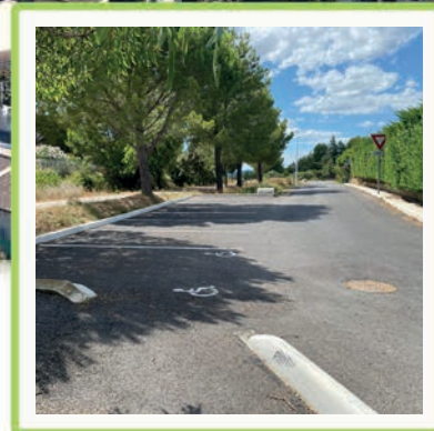
TRAVAUX DE VOIRIE