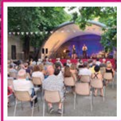
CONCERTS À CAVEIRAC