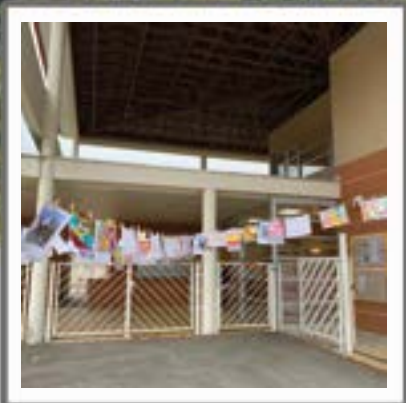
TRAVAUX DES ÉCOLES

Trois ans au service des Caveiracoises et des Caveiracois