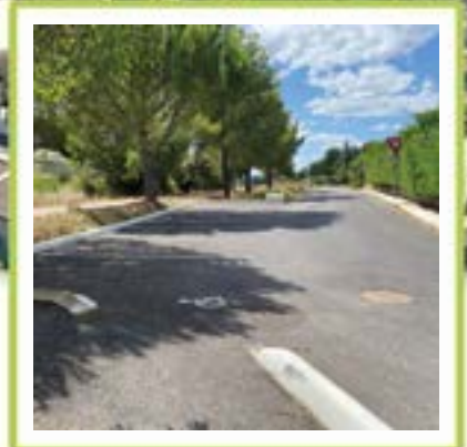
TRAVAUX DE VOIRIE