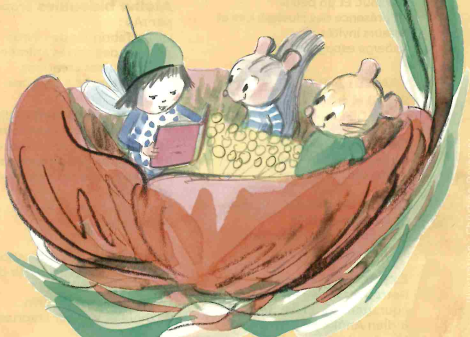
Illustration : Christine Devenic