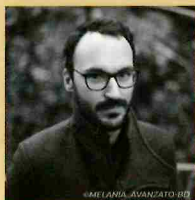
Gazhole Présent le Samedi de 10 h à 14 h !