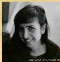
Cruschiform Présente le Samedi de 10 h à 14 h !